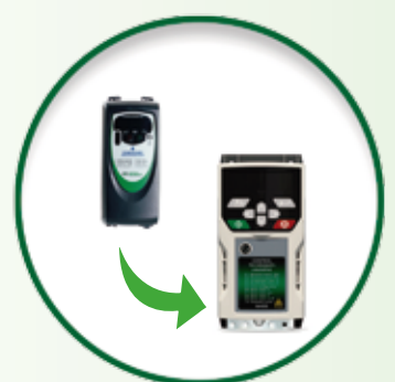
Commander SE Unidrive M400

Desde 2015, Commander SK y Unidrive SP están pasando a ser productos en desuso, por lo que, debido a la reducción del volúmen de su producción, pueden verse sometidos a cambios de precio y plazo de entrega. Se prevé que el período de transición dure dos años, seguido del período de mantenimiento. Cuando el Commander SK y Unidrive SP pasen al período de mantenimiento de su vida útil, se interrumpirá el volúmen de producción de dichos productos.