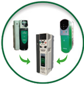
Unidrive SP, Unidrive V3 Unidrive M700

El avance tecnológico no es ajeno a Control Techniques. Por ello prestamos el servicio de Migraciones de tecnologías anteriores a la última generación de variadores y servomotores.