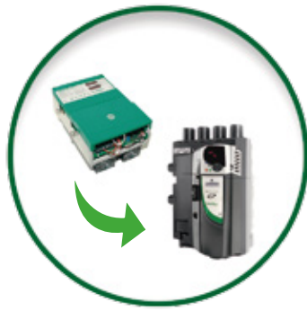
Mentor II - Mentor MP