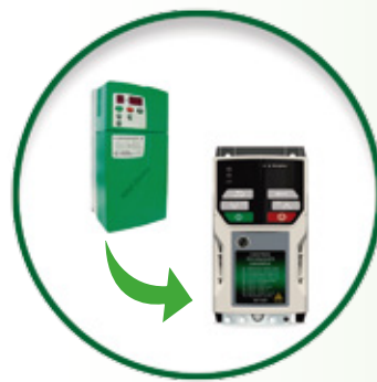
Commander SE Unidrive M100